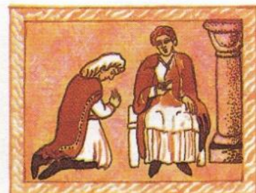
3. slib nápravy a modlitby - nařizuje kněz po zpovědi