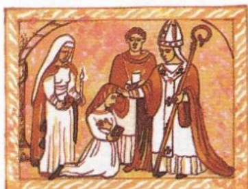
1. potvrzuje vstup člověka do křesťanské církve

Úkol č. 7 Obrázky představují některé z křesťanských svátostí. S pomocí nabídky je urči