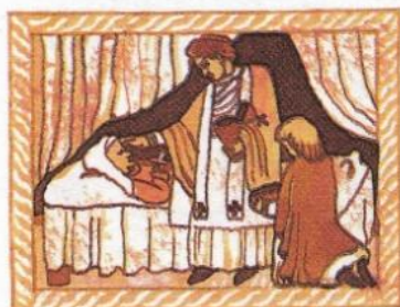
4. udílí kněz umírajícímu na znamení odpuštění jeho hříchů