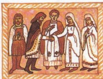
5. musí být posvěceno knězem a člověk je nemůže ze své vůle rozloučit