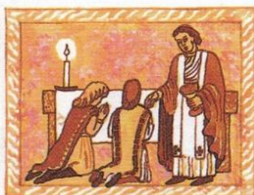
2. připomíná poslední večeři Ježíše s učedníky